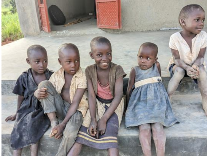
Kinderen op visite

Van de grote truck heb ik helaas geen foto.