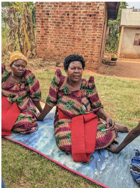
Kennis maken met Bukolokoti leader