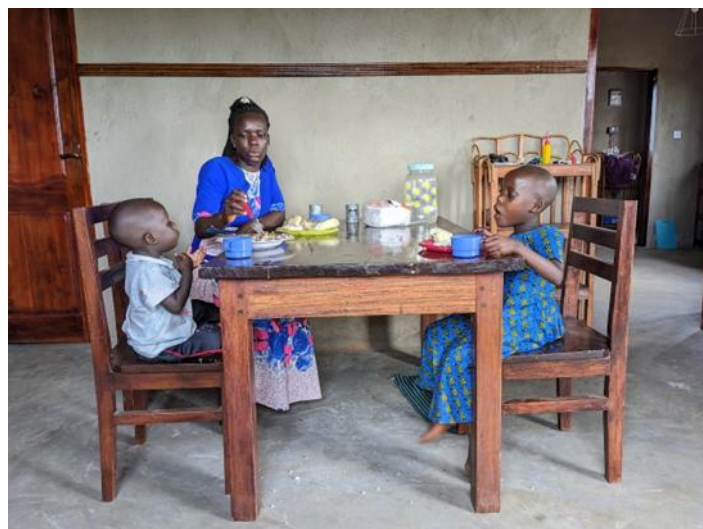
Otiva and family

Where people are welcome and we can be reached.